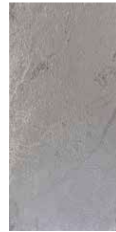
Supreme Silver 49,75x99,55 cm 19.59"x39.19" G-3844