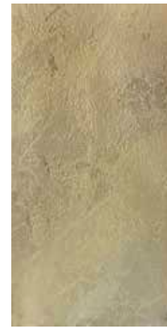
Supreme Gold 49,75x99,55 cm 19.59"x39.19" G-3844