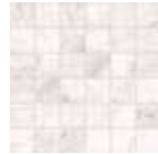
Supreme White Natural Mosaico 5x5 29,75x29,75 cm - 11.71"x11.71" G-3558