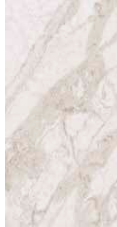
Supreme White Natural 49,75x99,55 cm - 19.59"x39.19" G-3194