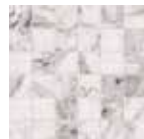
Supreme Blue Natural Mosaico 5x5 29,75x29,75 cm - 11.71"x11.71" G-3558