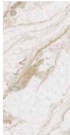
Supreme Noce Natural 49,75x99,55 cm - 19.59"x39.19" G-3194