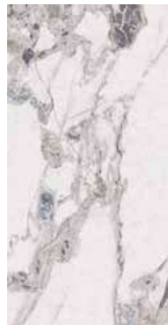
Supreme Blue Natural 49,75x99,55 cm - 19.59"x39.19" G-3194