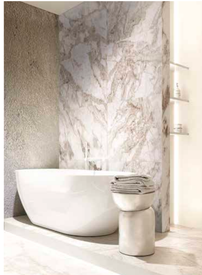
Supreme Noce Natural | White Natural | Silver 49,75x99,55 cm